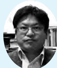
鳥取大学医学部 環境予防医学分野 教授