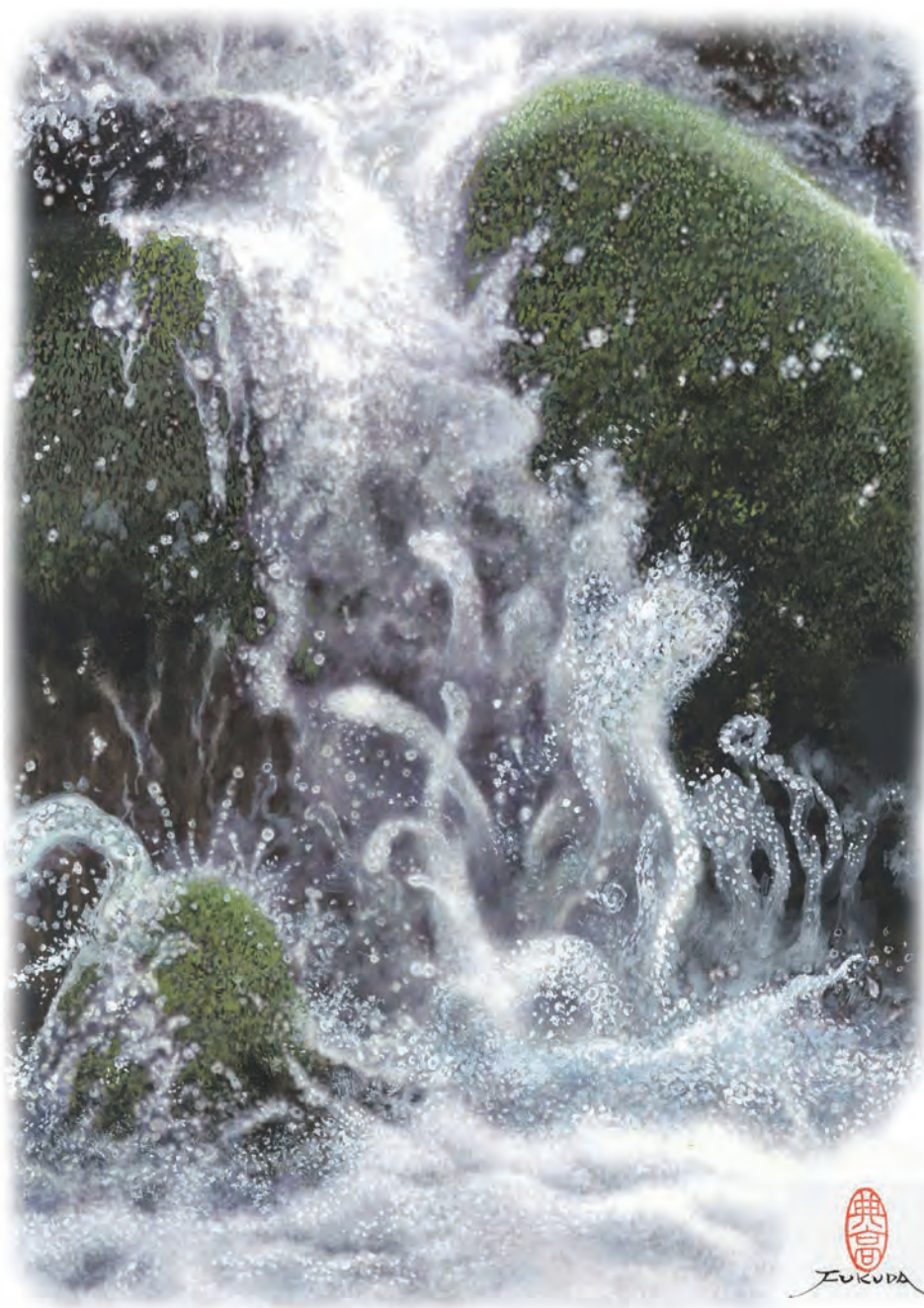
ダンスィングウォーター（油彩画画 10号） （鳥取県美術家協会会員 福田典高氏）