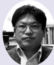
鳥取大学医学部 環境予防医学分野 教授