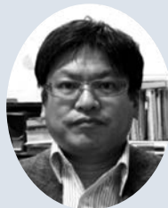
鳥取大学医学部 環境予防医学分野 教授

心不全の成立には何十年もかかるとされています。したがって、その兆しに気づいて、早めに対処すれば、防ぐことができるのです。日本循環器学会と日本心不全学会では、高血圧や糖尿病、脂質異常症、肥満といった生活習慣病があれば、すでに心不全のステージAという予備段階にあると位置づけています。心臓の疾患である、心肥大や心筋梗塞、心房細動などの不整脈が出てきた段階を心不全の前段階であるステージBとしています。すなわち、ステージAのうちは自覚症状がないことも多いのですが、背景にある疾患の治療をしっかりと行い、それに合った生活習慣改善を行い、ステージBにならないようにすること、ステージBでは、心不全にならないようしっかりと治療し、心臓のリハビリをすることが大切です。心不全になりかけの場合も、前述の症状にいち早く気づき、治療を開始することが、重症化防止のためには重要です。