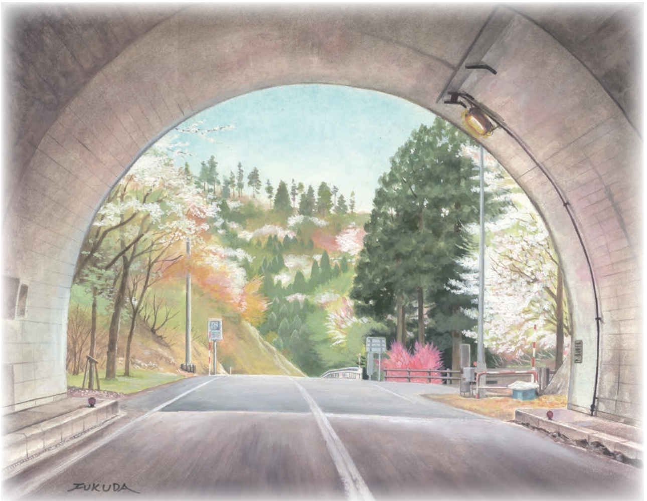
まぢトンネルの春(8号水彩画) (鳥取県美術家協会会員 福田典高氏)